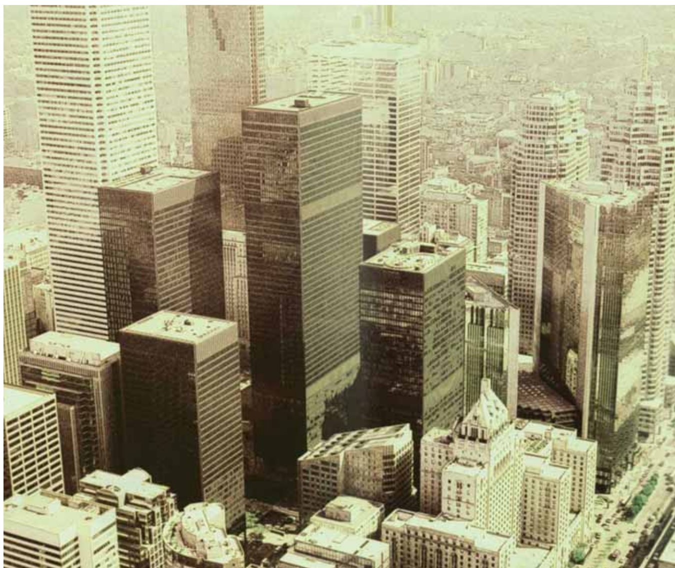
Fig. 1. Desarrollismo y Modernidad.

El Urbanismo que hemos conocido, el que ha guiado la construcción del espacio urbanizado a lo largo del siglo XX, ha sido el Urbanismo de la sociedad industrial, el de la Modernidad. El Movimiento Moderno, como icono, tótem e incluso tabú, ha sido su plasmación plástica más conocida, y aplicada. Pero con independencia de su formalización, el Urbanismo de la Modernidad se ha basado en tres valores fundacionales, centrales: racionalidad , desarrollismo o productivismo y reformismo , va-