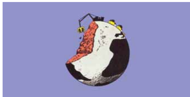
Fig. 3. Sostenibilidad y límites, o desarrollismo y ecosuicidio.

Un Urbanismo alternativo a tan limitado modelo, no puede discurrir por esta alfombra de negocio, gloria y glamour. El Urbanismo debe volver a ser social, recuperar sus objetivos primigenios, y metodológicamente no limitarse al Proyecto